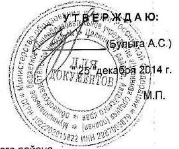
ГРАФИК ПРОВЕДЕНИЯ ТО И ППР №ТО- 016/14 на 2015 год

"Верх-Яминская основная общеобразовательная школа" филиал МБОУ «Целинная средняя (полная) общеобразовательная школа №1» Целинного района (наименование объекта)